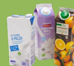
картонные от коробки напитков