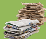
Макулатура и картон