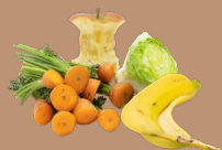
Отходы от овощей и фруктов

Bioabfall // Organic waste // Biyo atıklar // Bioodpady // Les déchets biodégradables // النفايات العضوية