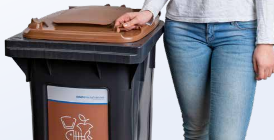
Erfreulich: sauberer Bioabfall im Landkreis.

Immer noch landen zu viele wertvolle Rohstoffe in der Restmülltonne. Unser gesellschaftliches Ziel muss eine echte Kreislaufwirtschaft sein, in der kaum noch Restmüll anfällt und alle Rohstoffe wiederverwendet werden.