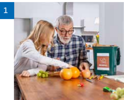
Mit dem getrennten Sammeln von Bioabfall können alle einen Beitrag zum Umweltschutz leisten.