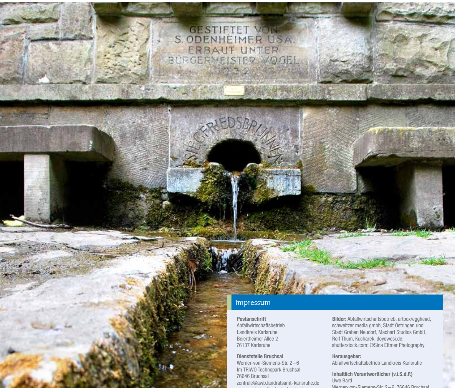
Siegfriedbrunnen in Odenheim

Infos zur Abfall App KA unter www.die-biotonne.de/abfallapp Kostenlos verfügbar für Android und iOS