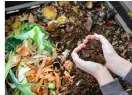
Ein Komposthaufen produziert wertvolle Komposterde für den Garten.

Bestimmte Speiseabfälle, wie z.B. gekochtes Essen oder Fleisch- und Fischreste dürfen nicht auf den Kompost, um keine Tiere anzuziehen. Ebenso wenig fetthaltige Speisen, Milchprodukte oder behandelte Schalen von Zitrusfrüchten oder Bananen. Aber all das darf auch nicht mehr in den Restmüll. Somit ist eine Biotonne oder das