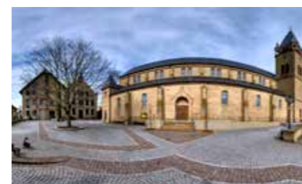
Blick auf das Rathaus und Pfarrkirche St. Cäcilia

Aus vier unterschiedlichen Teilen ist seit der Gemeindefusion in den 1970er Jahren aus der Kernstadt Östringen und den Stadtteilen Odenheim, Tiefenbach und Eichelberg eine neue Einheit zusammengewachsen.