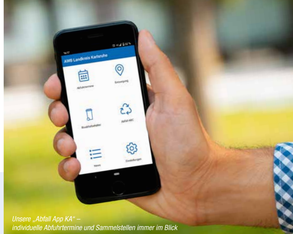
Unsere „Abfall App KA“ – individuelle Abfuhrtermine und Sammelstellen immer im Blick

Bestens informiert rund um die Abfallentsorgung – nutzen Sie schon die Abfall App KA?