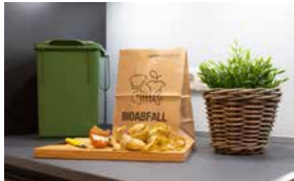
Sauber und hygienisch – Biomüll im Vorsortierer sammeln.

Biotonne sparen sich zusätzlich auch den regelmäßigen Abtransport von Rasenschnitt, Laub oder kleineren Ästen auf den Grünabfallsammelplatz – denn in kleineren Mengen können sie problemlos über die Biotonne mit entsorgt werden. Ein Grund mehr, ein kleines Eckchen für die Biotonne zu reservieren und sich gemütlich zurückzulehnen.