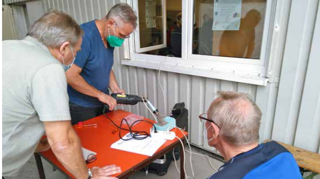
Repair-Café in Östringen – Beitrag zur Abfallvermeidung und gegen die Wegwerfgesellschaft.