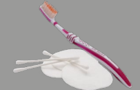
Artículos de higiene