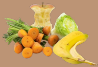
Restos de frutas y verduras

Bioabfall // Organic waste // Biyo atıklar // Биомусор // Les déchets biodégradables // النفايات العضوية